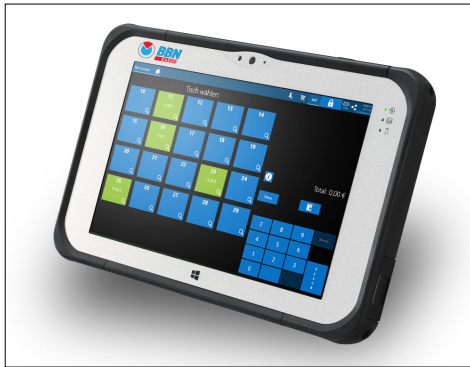
Die robuste Tabletkasse für den mobilen Einsatz.

jederzeit schnell auf Veränderungen – hilfreich insbesondere für Sondertage wie etwa Feiertage.